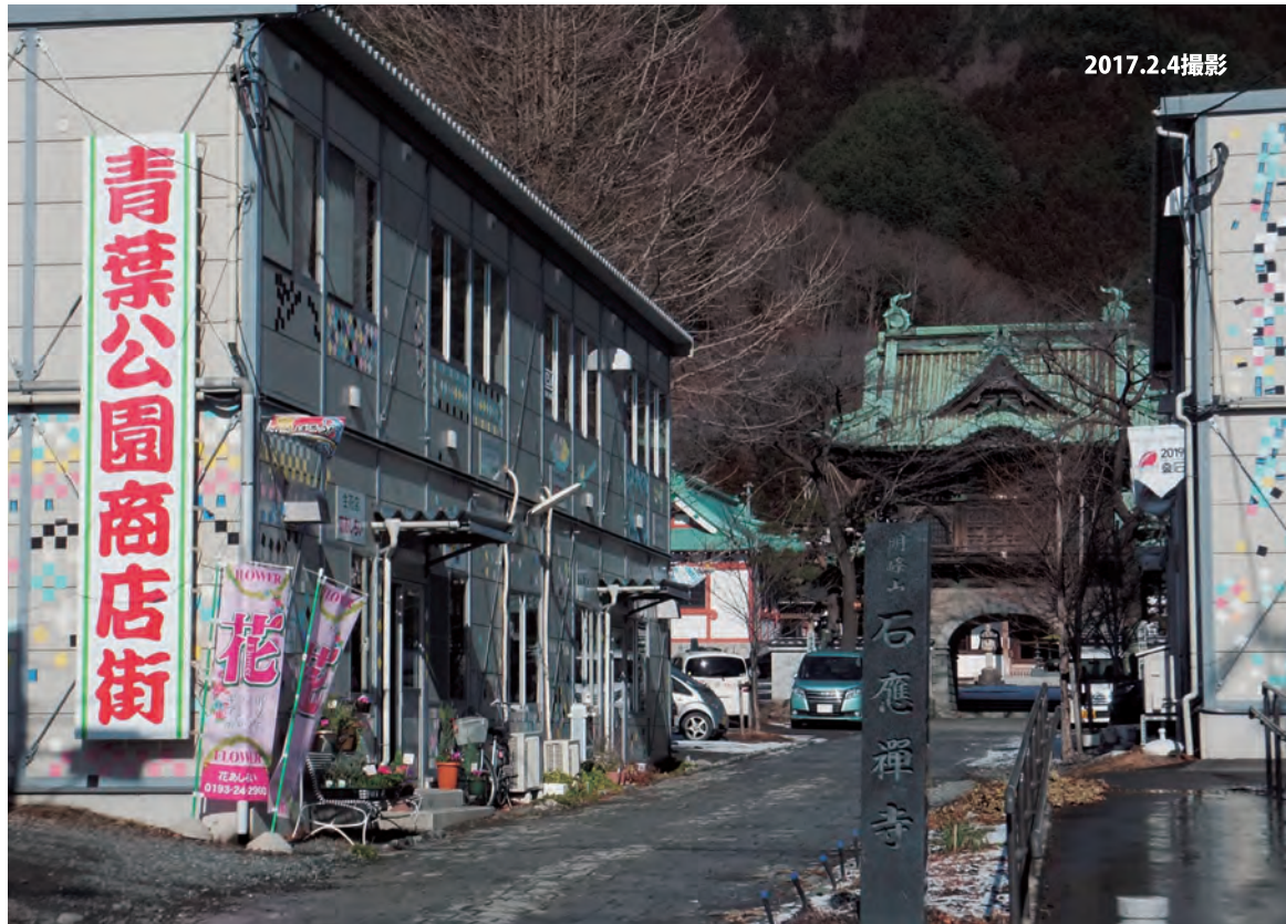
石応寺前から撮影